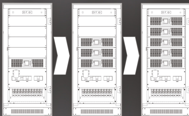
L'onduleur peut augmenter en fonction des besoins de puissance ultérieurs

Les modules constituant le "Modular Power", de seulement 3U de hauteur, rassemblent les plus hauts standards techniques de disponibilité et d'efficacité. Ils préservent ensemble les charges sensibles des coupures d'énergie, des parasites secteur, des pics de tension et de courant, des pollutions harmoniques générées par des interférences de commutations sur le secteur, et d'autres risques.