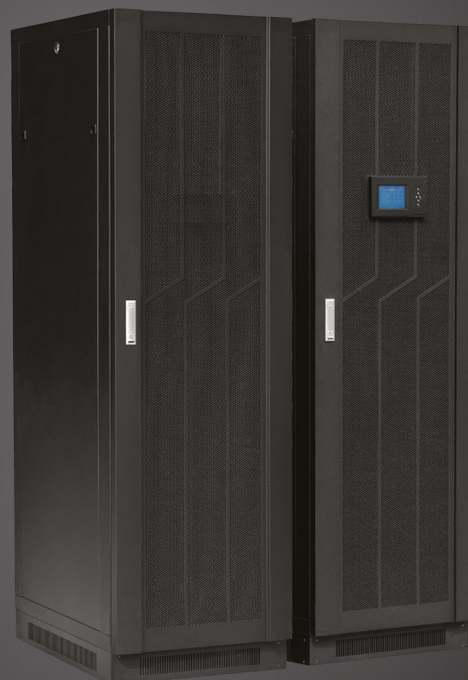
Armoire batterie externe et son onduleur